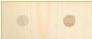
ノンヘッドキャップ ダボ穴用